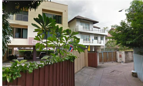
ศูนย์อบรม วี อาร์ ดิจิตอล เทรนนิ่ง เซ็นเตอร์

ทางเข้าศูนย์อบรม วี อาร์ ดิจิตอล เทรนนิ่ง เซ็นเตอร์