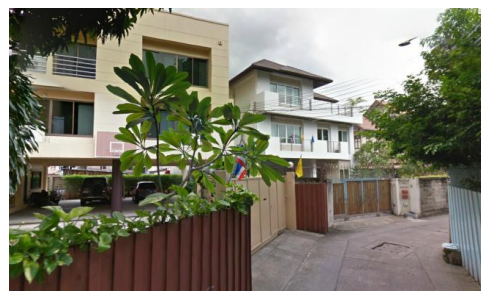
ศูนย์ฝึกอบรม วี อาร์ ดิจิตอล เทรนนิ่ง เซ็นเตอร์ (อาคารสีครีม ประตูรั้วเหล็กสีครีม)